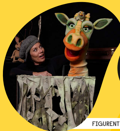
FIGURENTHEATER MOVING PUPPETS

0179 – 2056271 | katrin@theater-funkenflug.de | www.theater-funkenflug.de