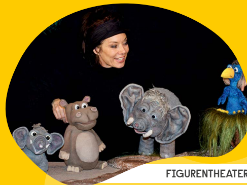
FIGURENTHEATER MOVING PUPPETS

04102 – 695692 | info@buehnebumm.de | www.buehnebumm.de